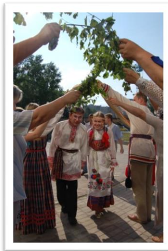
«Праздники и обряды»